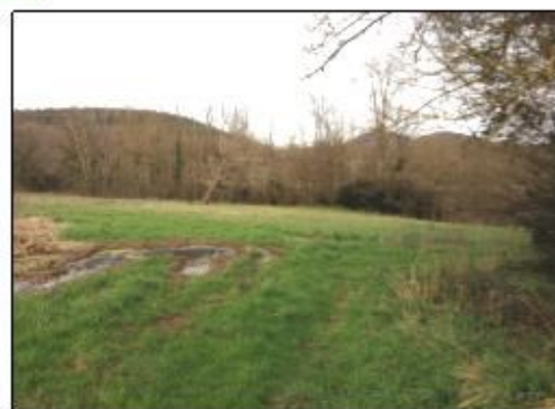
Station d'épuration actuelle et terrain d'implantation de la nouvelle station