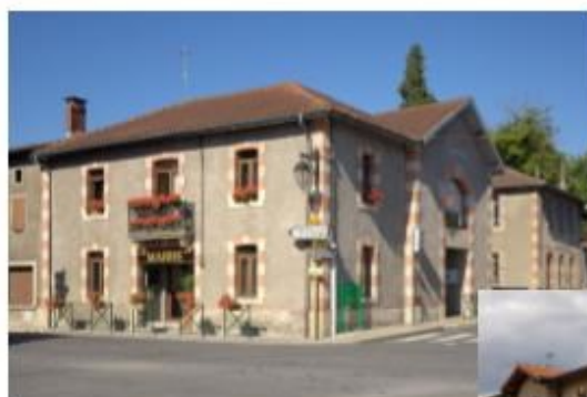
Mairie et ancienne maison Boube