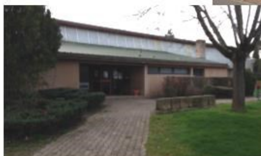
Salle du 1er Mai