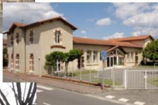
Ecole Primaire et médiathèque