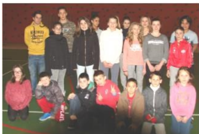
Le groupe aéro boxe du mercredi