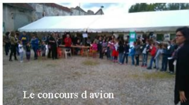
Le concours d'avion