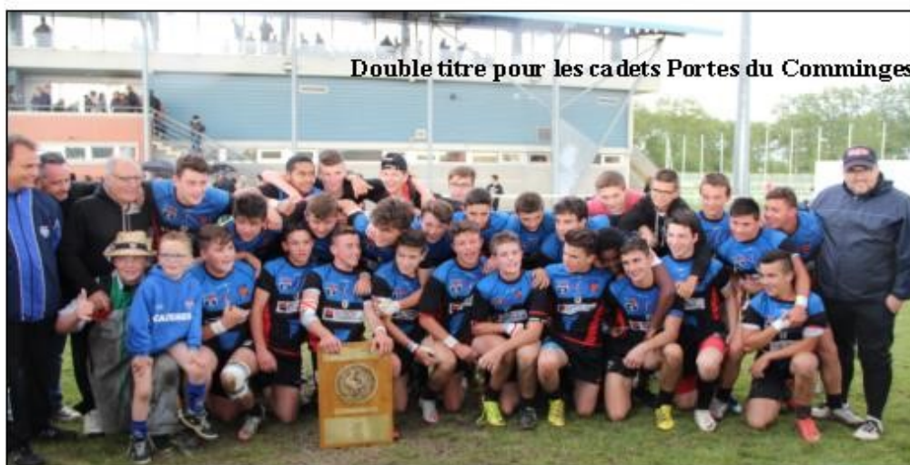
Double titre pour les cadets Portes du Comminges

11/09 Reprise du Championnat (RC La Salvetat Plaisance – entente Vallée du Girou - Coq Leguevinois - A.S. l'Isle/Tarn - stade Saint-Gaudinois Luchonnais - S.A. Auterive - Avenir Muretain.RC Eaunes - U.S. Caussade - MCS - ST Juery A.O.R.)