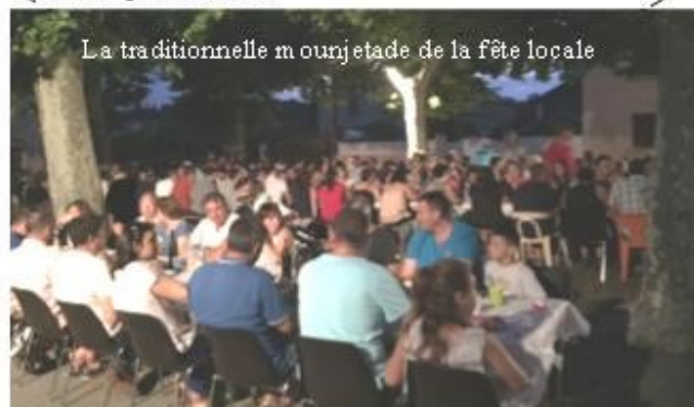
La traditionnelle mounjetade de la fête locale

A réfléchir pour la prochaine édition afin que des petits aux grands, chacun trouve son espace festif.