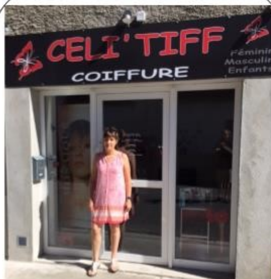
Ouverture du nouveau salon Céli'Tiff rue du Stade