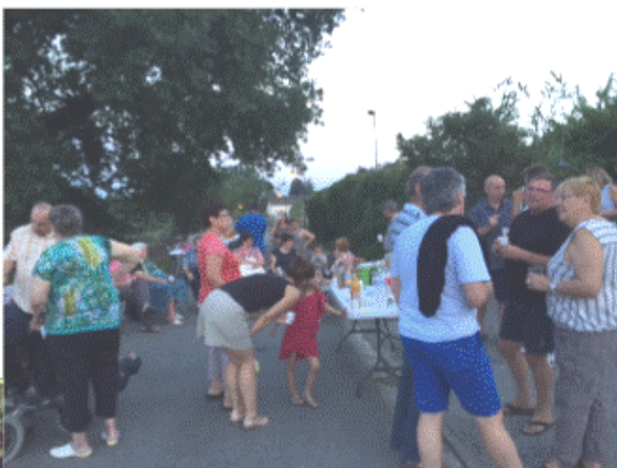
Repas de quartier du Cap del Bosc le 24 août dernier