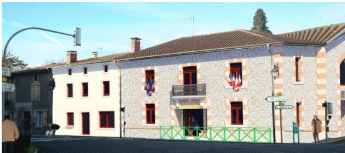
La mairie après réhabilitation