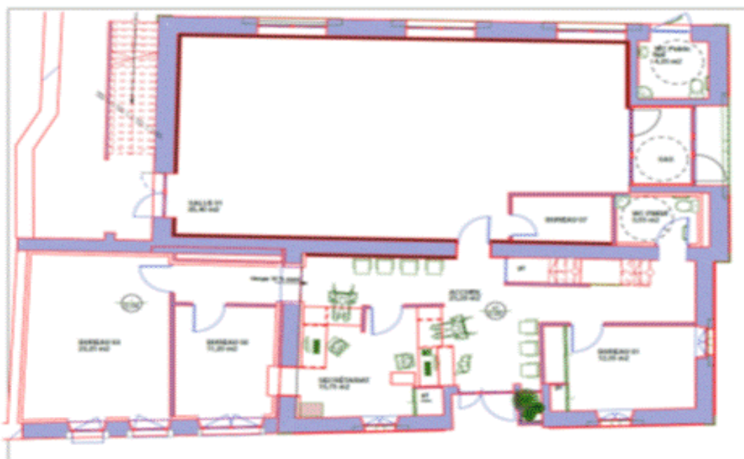
Rez-de-chaussée (après réhabilitation)