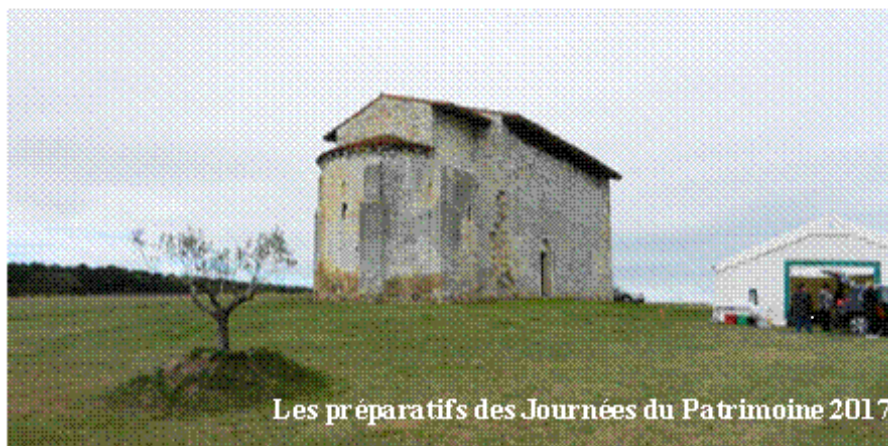
Les préparatifs des Journées du Patrimoine 2017