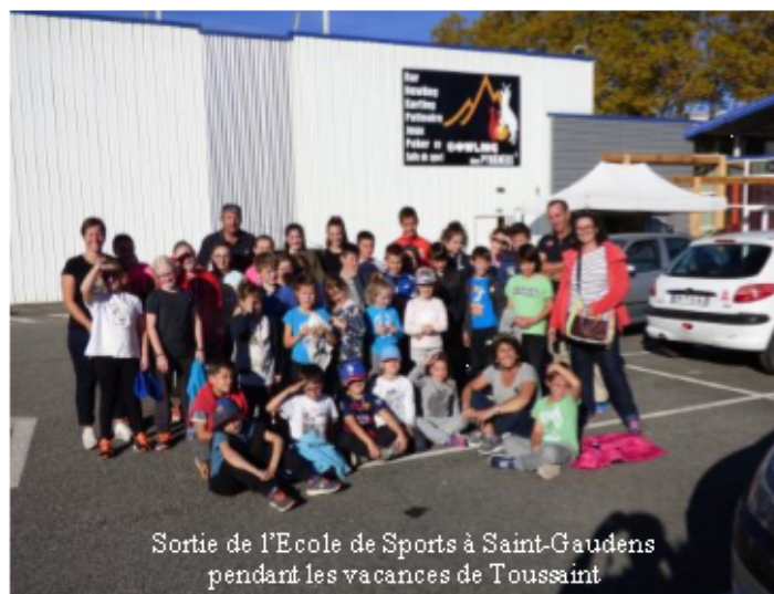
Sortie de l'Ecole de Sports à Saint-Gaudens pendant les vacances de Toussaint

SAMEDI 2 DECEMBRE 2017 Le MCS fait son cabaret À 19H30 Salle du 1er Mai à Mazeres Soirée de Gala - 39 € / pers Rés: mairie : 05 61 97 48 22 - mairie-mazeres2@wanadoo.fr Organisé par le MAZERES CASSAGNE SPORT