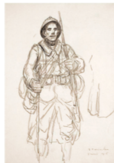
Le poilu, Steinlen