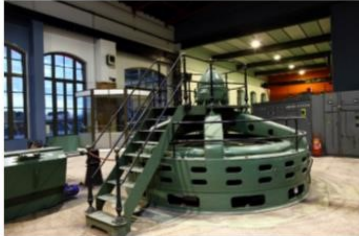
La salle des machines