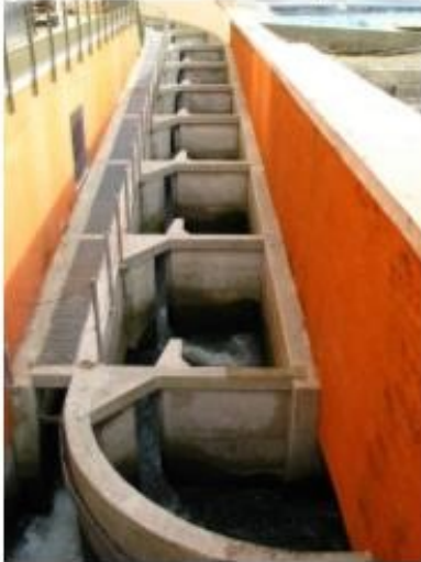
La passe à poissons

Ils peuvent aussi observer les poissons de la Garonne grâce à la passe à poissons qui leur permet de passer le barrage du Bazacle.