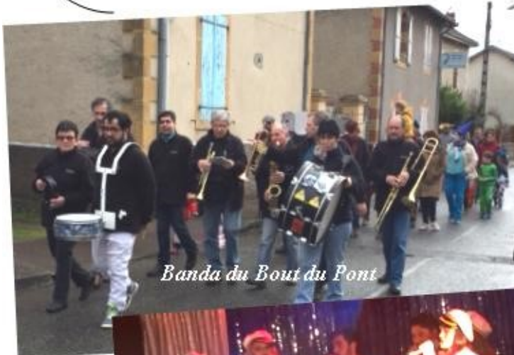
Banda du Bout du Pont

Il a fallu beaucoup d'énergie pour préparer ces 2 week-end de fête avec énormément de travail en amont pour "gérer" les deux animations en même temps mais à la sortie ce sont les remerciements et la gentillesse des participants qui nous font oublier tout ça !