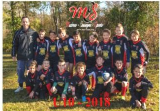
Les M10 prêts pour la fin de saison