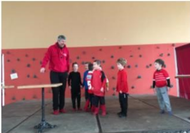
Fin d'entraînement M6 en chanson dans la salle du 1 er mai pour faire revenir le soleil ☀