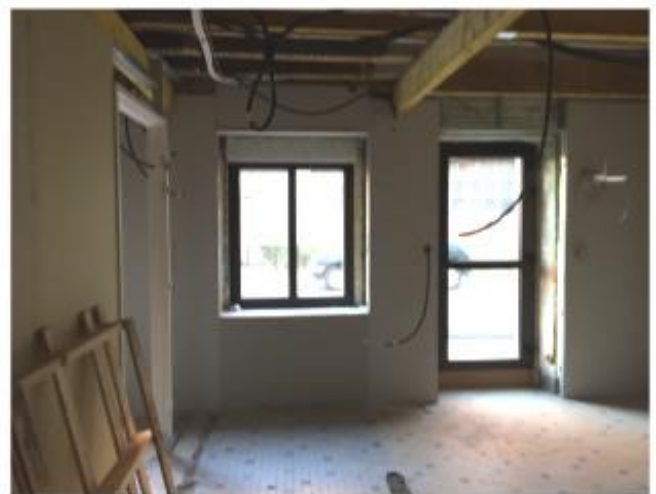
Nouveau bureau à l'ancienne maison Boube