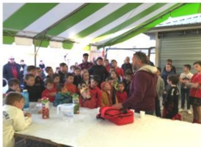
Goûter des Rois de l'Ecole de Rugby

Le dimanche 11 février, l'école de rugby organisera le repas d'avant match, nous vous attendons nombreux.