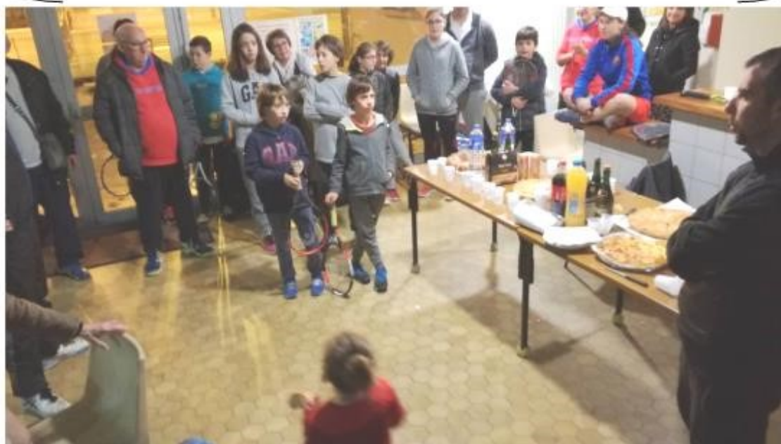
Soirée Galette des Rois

Retrouver l'actualité du club sur la page Facebook « Boussens Cassagne Mazères Tennis » et twitter « BCM TENNIS » ainsi que sur le site internet http://www.club.fft.fr/bcm-tennis .