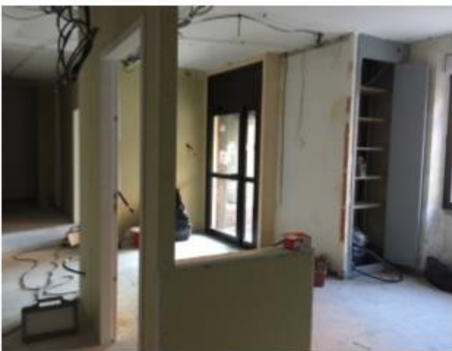
Nouvel accueil de la Mairie