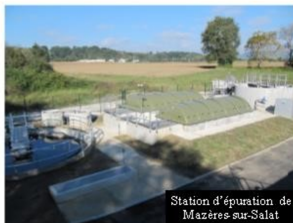
Station d'épuration de Mazères-sur-Salat

Le process utilisé dans le fonctionnement de la nouvelle station repose sur une dégradation biologique des effluents couplée à une filtration mécanique des déchets grossiers contenus dans les eaux usées.