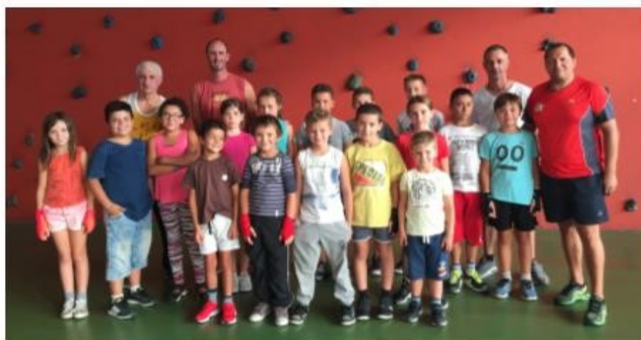
Les petites boxeuses et boxeurs avec leurs coaches

Ci-joint notre équipe de baby boxeurs du mardi. N'oubliez pas d'aller visiter notre page facebook Boxing Club du Salat.