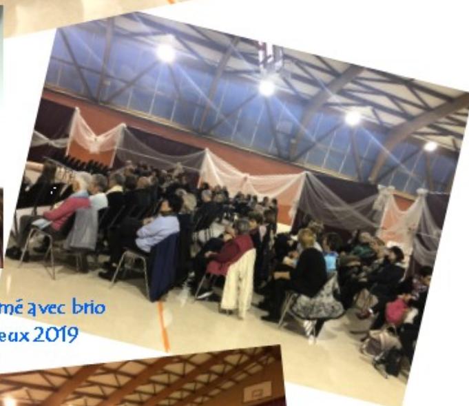
La chanteuse Rudy a animé avec brio la présentation des vœux 2019