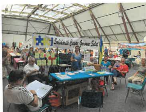
Forum des associations à Aspet