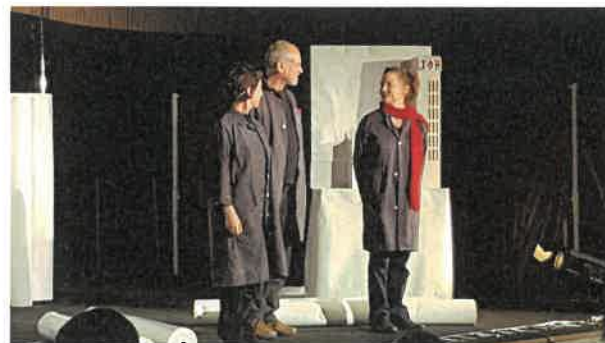
Mémoire de papier(s)