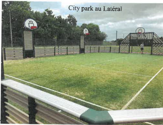
City park au Latéral