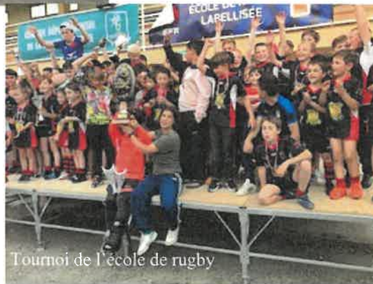
Tournoi de l'école de rugby