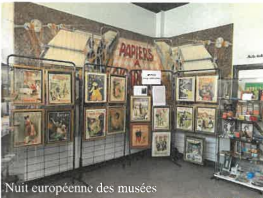
Nuit européenne des musées