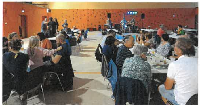
Fête de la musique et feu de la Saint Jean