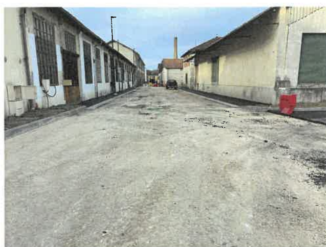
Urbanisation de la zone Lacroix