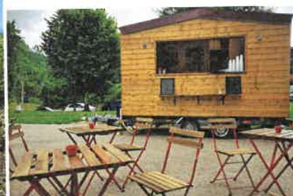
La goulotte occitane