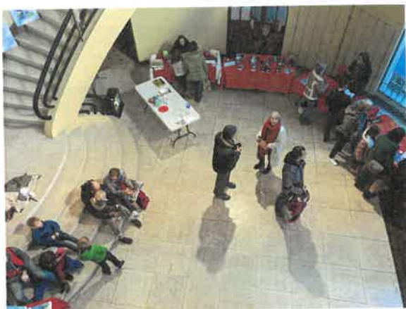
Salon du livre jeunesse