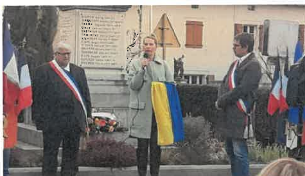
Manifestation contre la guerre en Ukraine