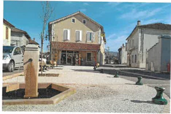
ouverture d'une boulangerie pâtisserie artisanale