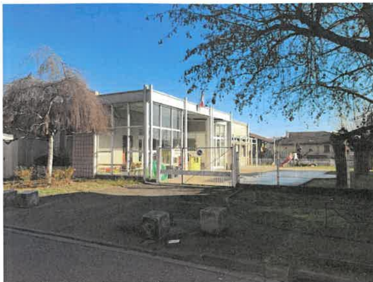
Réfection de la toiture de l'école maternelle