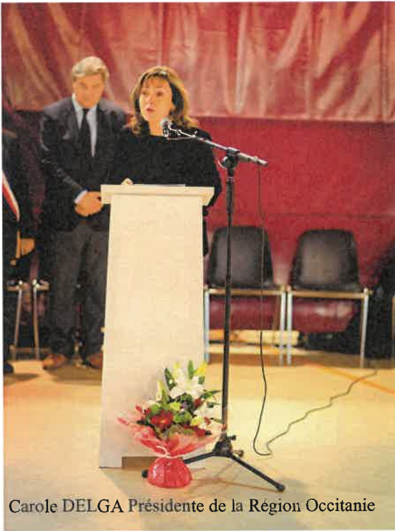
Carole DELGA Présidente de la Région Occitanie