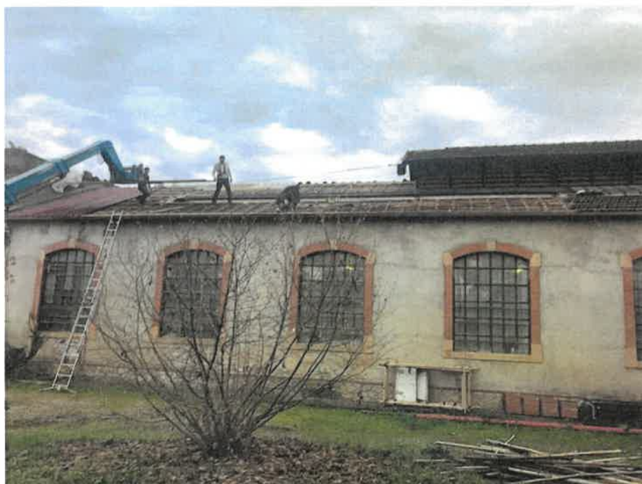
Toiture du nouveau boulodrome