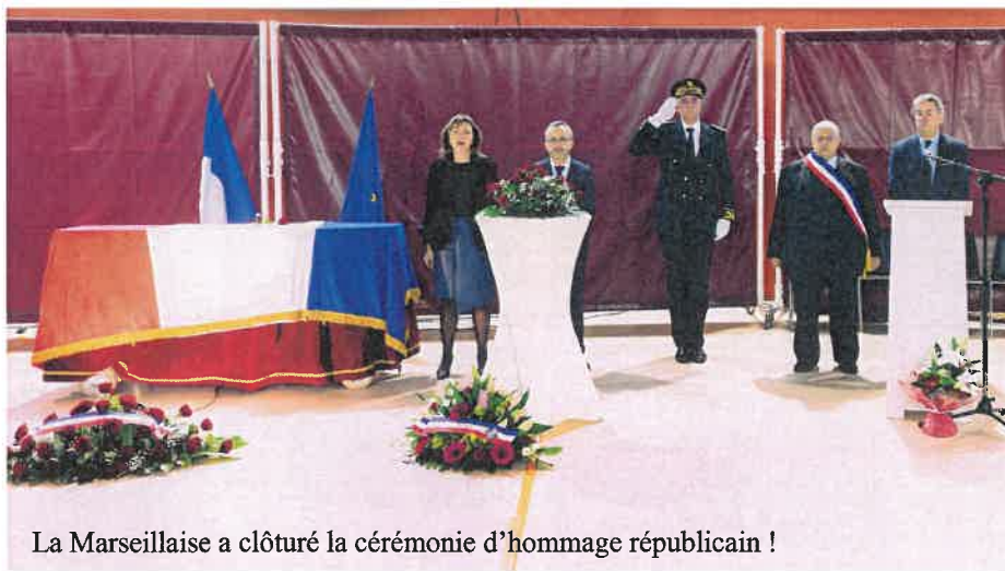
La Marseillaise a clôturé la cérémonie d'hommage républicain !