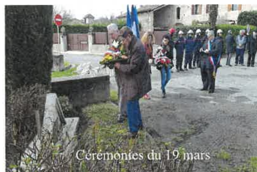
Cérémonies du 19 mars