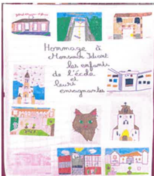
Dessins des enfants de l'école en hommage à M. Jean-Louis IDIART