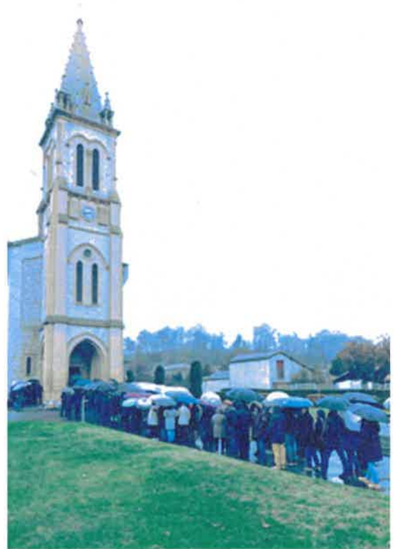
Entrée église Saint-Christophe à Mazères sur Salat