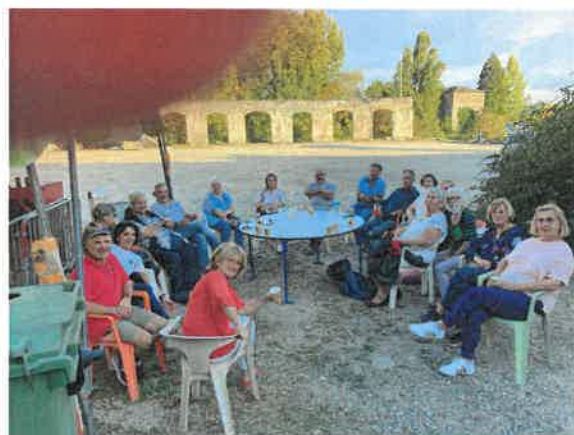
Vide grenier association Solidarité Cagire Garonne Salat